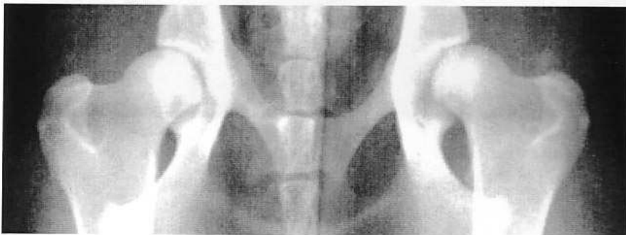
Radiographie 14 : Avec anesthésie Classe C