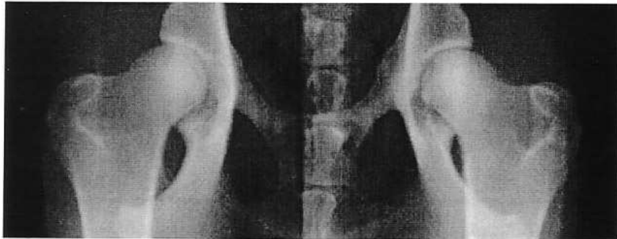
Radiographie 13 : Sans anesthésie Classe B

La subluxation de l'articulation est un critère déterminant dans le dépistage radiographique de la dysplasie : plus la laxité de l'articulation est importante, moins elle est stable, et plus le risque de développement d'arthrose est important. L'anesthésie ou la sédation poussée